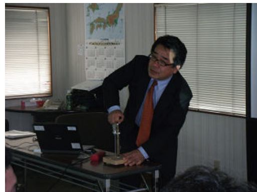
酸素ガスについて