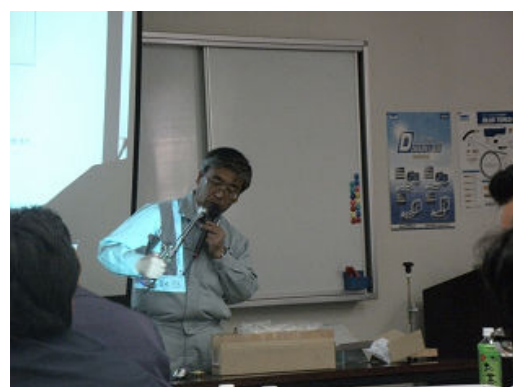
切断機器について