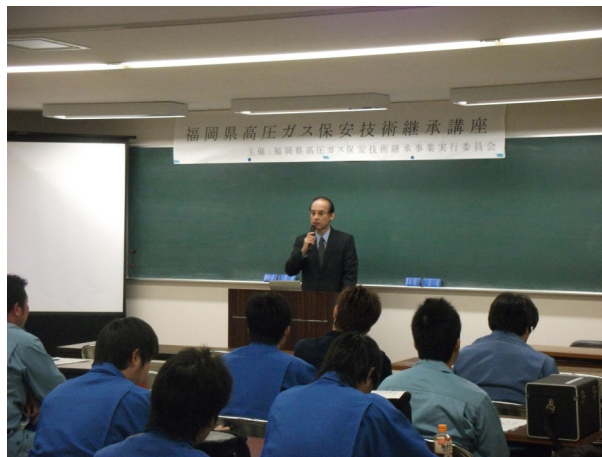
主催者挨拶（安永工業保安課長）

また、今年も会場をご提供いただきました(社)福岡県LPガス協会様、ありがとうございました。