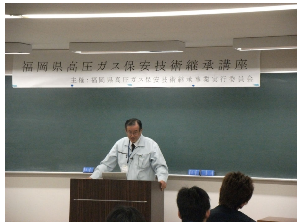
関係法令について（津村講師）