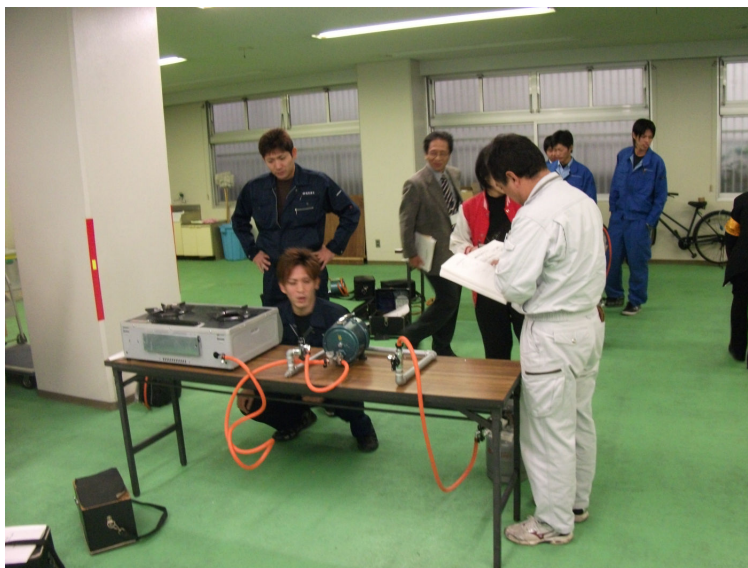
モデル配管による漏えい試験実習