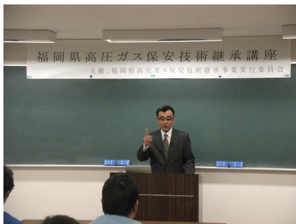
調査点検伝票記入要領（開講師）