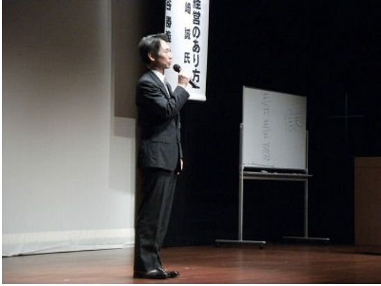
閉会の辞（久継副会長）