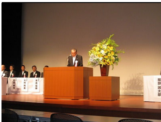
開会の辞(寺崎副会長)