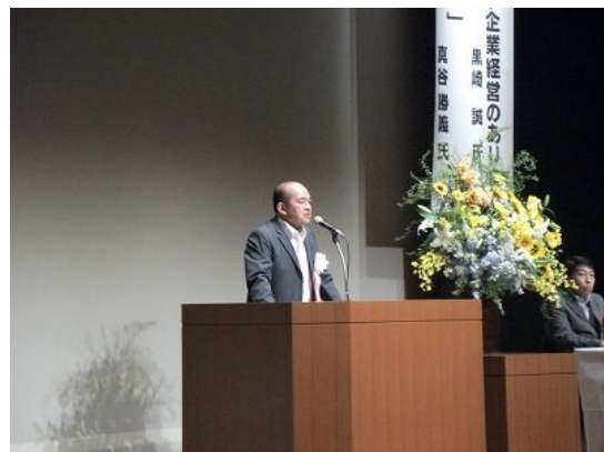
会長挨拶(福田会長)