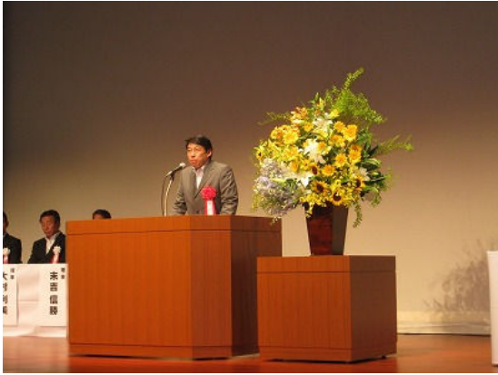
福岡県副知事挨拶