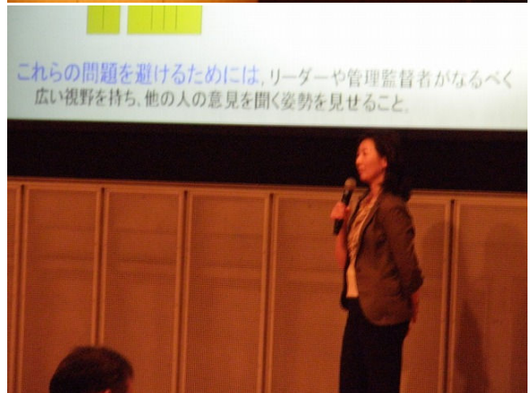
申講師 講演「ヒューマンエラーと不安全行動」