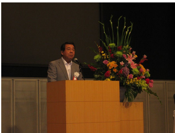
開会の辞 (小金丸副会長)