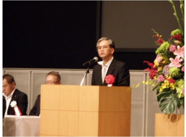
顧問（九州産業保安監督部長）挨拶