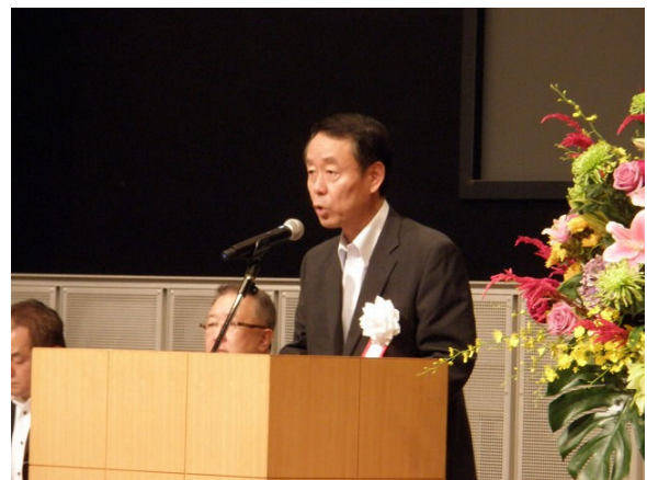
会長挨拶 (田崎会長)