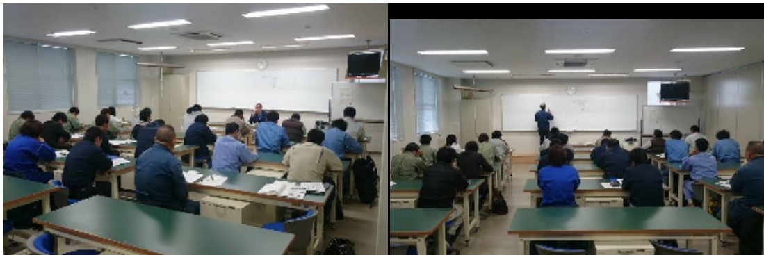
冷凍装置の運転管理について

また、今年も会場をご提供いただきました福岡県立福岡高等技術専門校様ありがとうございました。