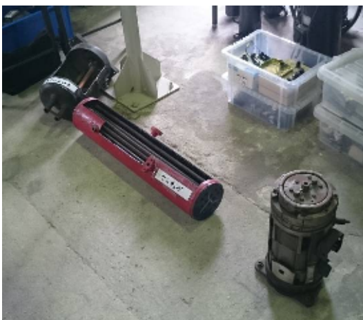
冷凍設備に用いられる機器の構造説明