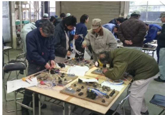
シーケンス組立実習