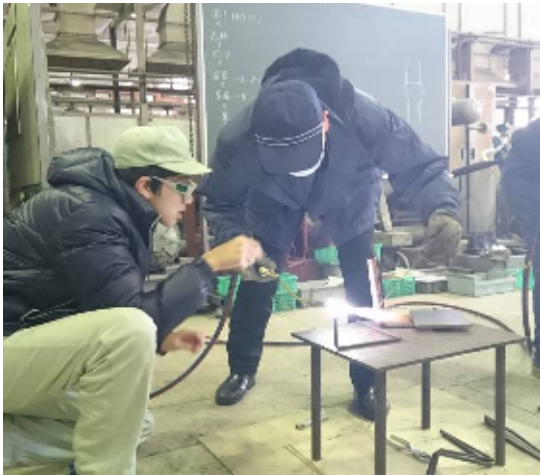
銅管溶接と銅管加工