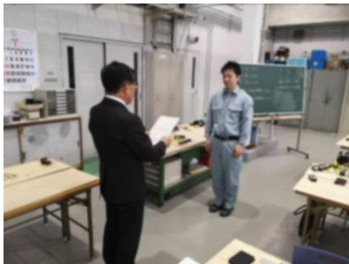
修了証授与の様子