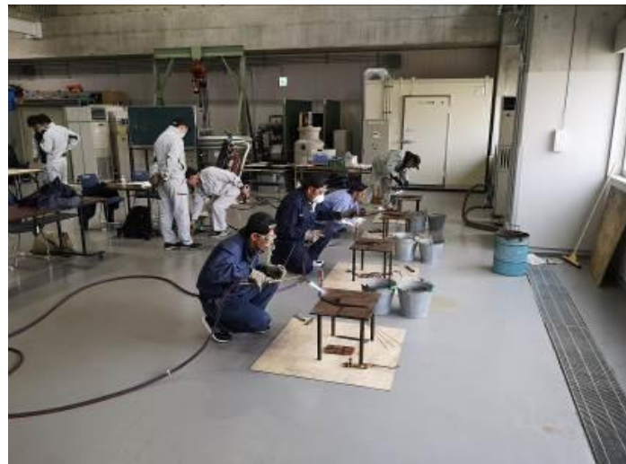
ろう付け加工の様子