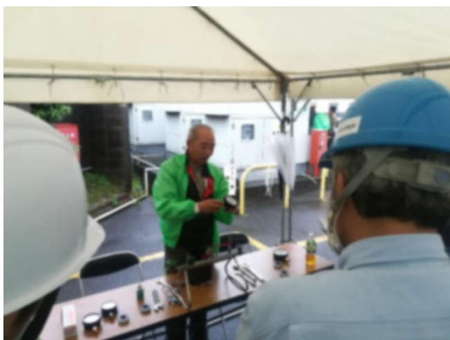
圧力計取替え実習、工具の使用法