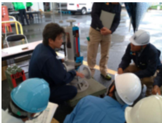
機器講習（ポンプ・圧縮機の構造）