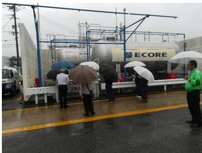
貯槽、機械室周りの設備点検