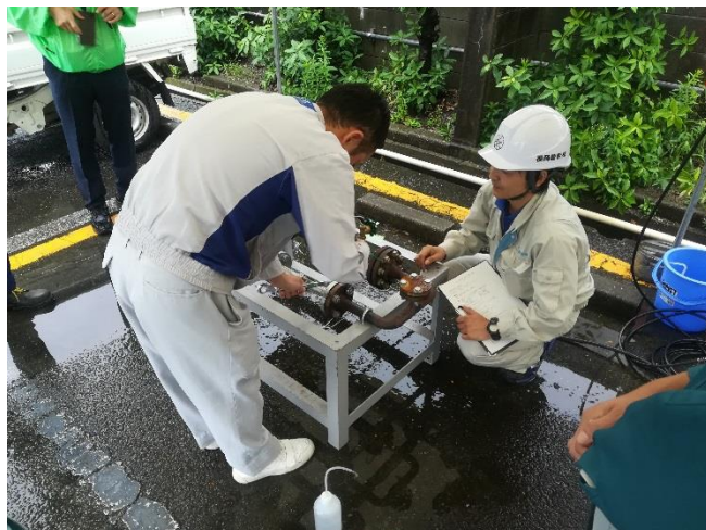
配管漏えい時の措置実習