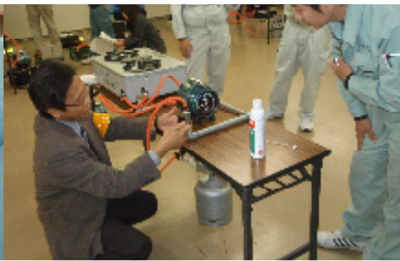
モデル配管による漏えい試験実習