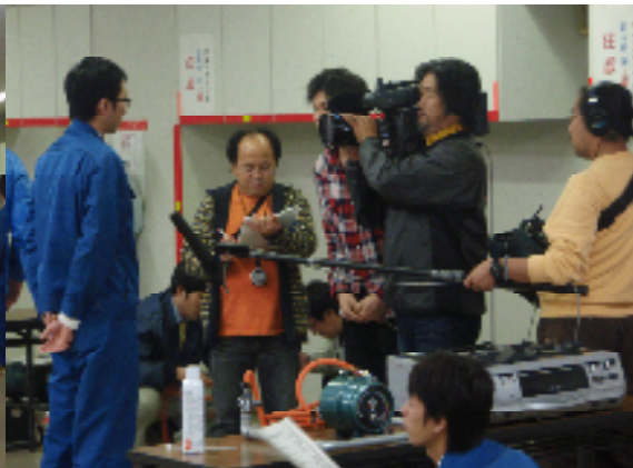
インタビューの様子