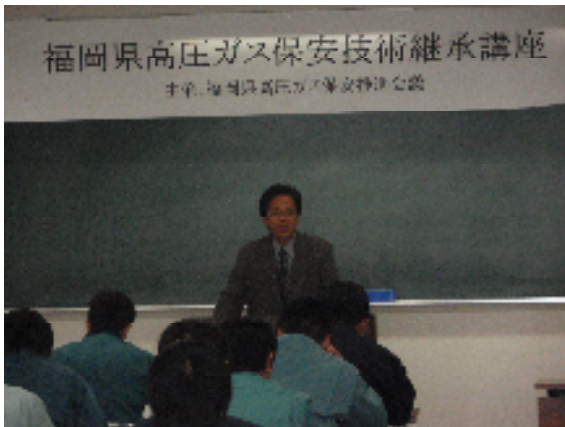
自記圧力計(機械式)の取り扱い