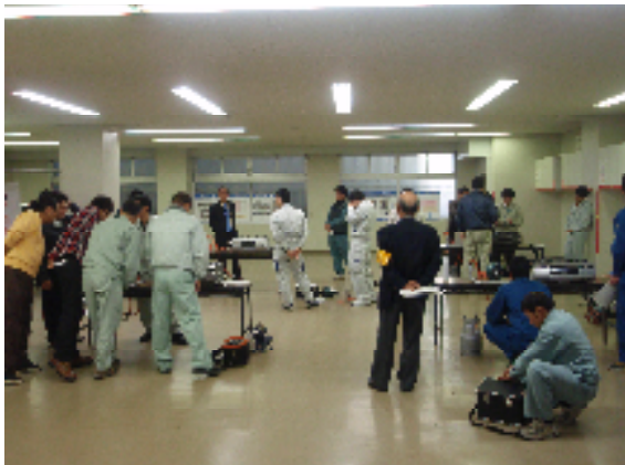
モデル配管による漏えい試験実習