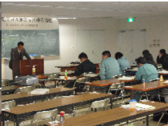
調査点検伝票記載実習