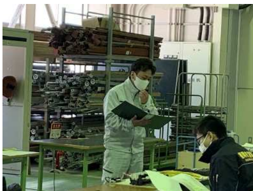
シーケンス組立の様子