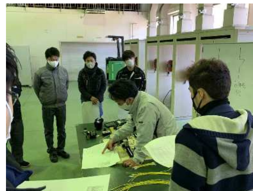
シーケンス組立の様子