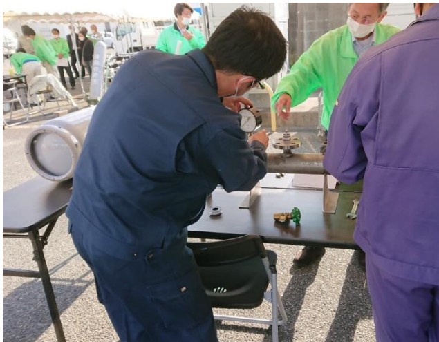
圧力計取替え実習、工具の使用法