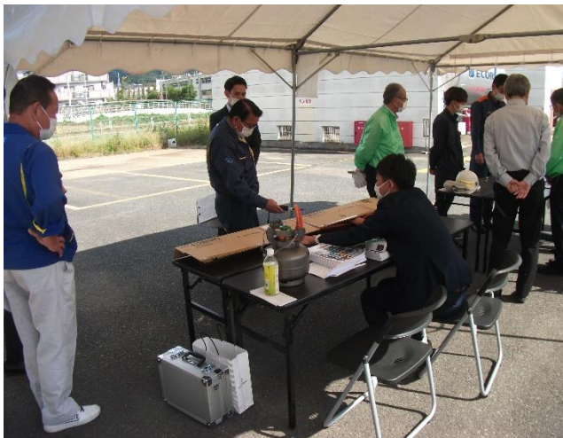
ガス漏えい検知器