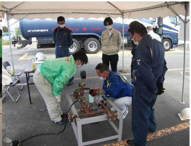
配管漏えい時の措置実習