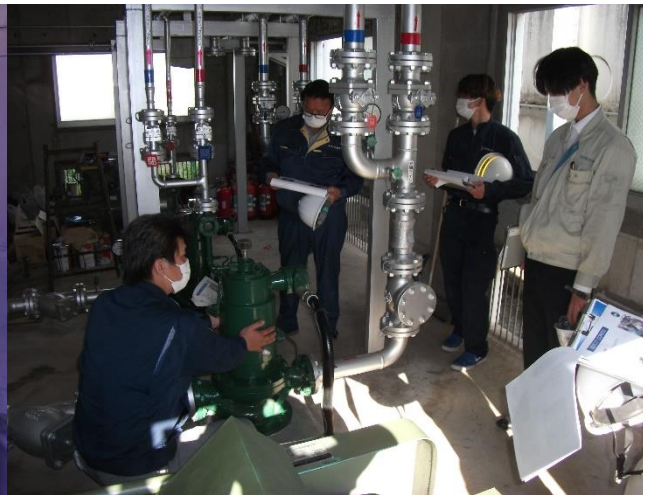
機器講習（ポンプ・圧縮機の構造）